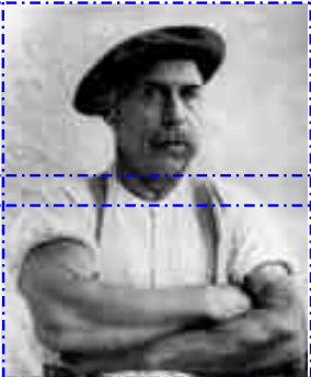
Retrato de Adolf Wölfli - CCO

Wölfli murió en 1930 tras lo cual se estableció una fundación para la conservación de su obra y sus trabajos fueron trasladados al Museo de Bellas Artes de Berna, donde siguen expuestos hoy día.