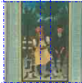
Schaut hier diesen Jungen-Knaben, 1905 - CCO