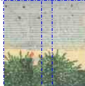
So in China nach Herzenslust, 1914 - CCO