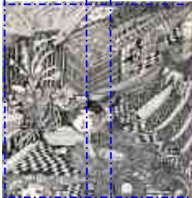
Untitled, 1950 - CCO