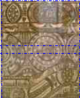
Adolf Wölfli, Hotel Berner-Hof, 1905 - CCO