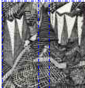
Untitled, 1950 - CCO