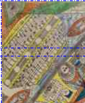
General view of the island Neveranger - CCO